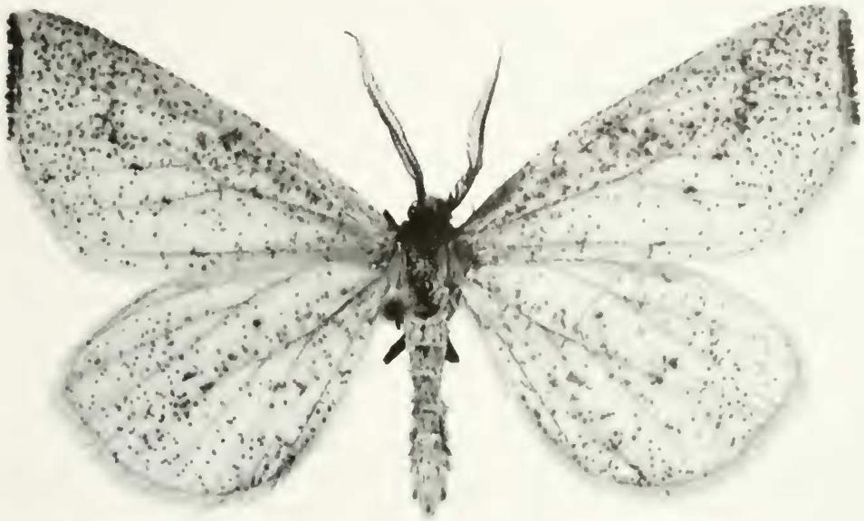
Abb. 4: Hypoxystis pluviaria F., in Bayern stark gefährdet (Rote Liste 2).